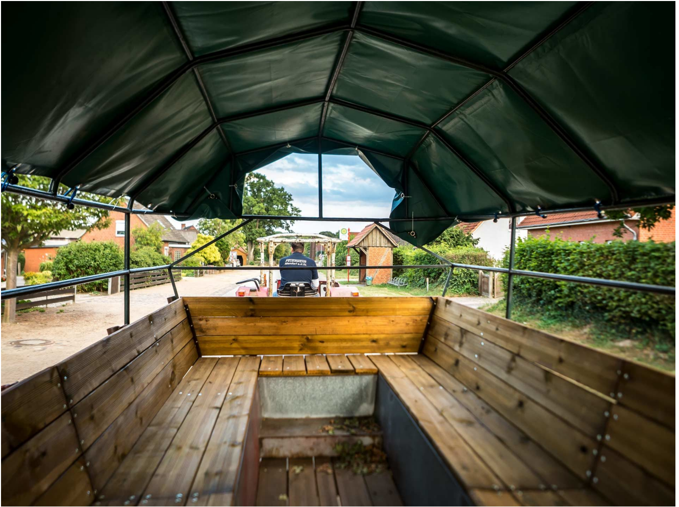
Niendorfer Partyshuttle.